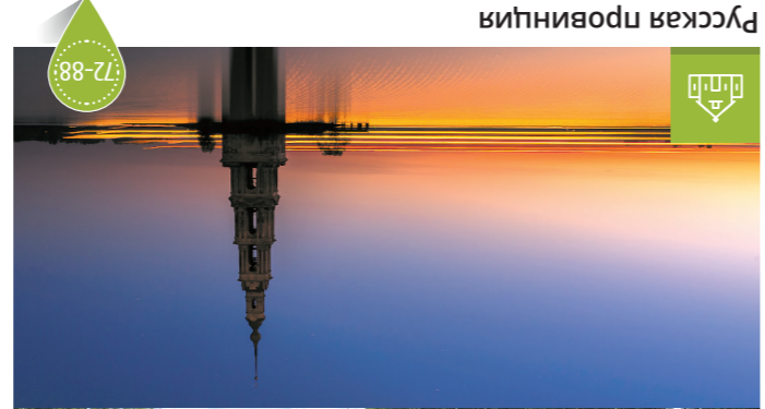
Исток Волги д. Волговерховье

Перед вами открывается целый мир русской провинции. Здесь вы можете увидеть удивительные памятники архитектуры, живописные пейзажи и многое другое.