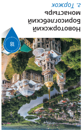
Новоторжский монастырь 2. Торжок

Монастырь основан в 1038 году и является старейшим в Центральной России. Первый каменный собор монастыря был построен в первой трети XVI века. Самая древняя сохранившаяся до наших дней постройка монастыря — Введенская церковь XVII века.