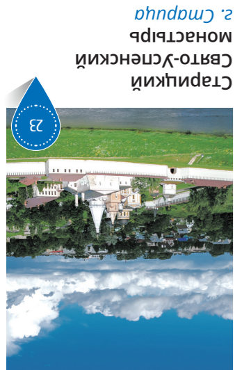
Старицкий монастырь 2. Старичиха

Монастырь основан в 1038 году и является старейшим в Центральной России. Первый каменный собор монастыря был построен в первой трети XVI века. Самая древняя сохранившаяся до наших дней постройка монастыря — Введенская церковь XVII века.