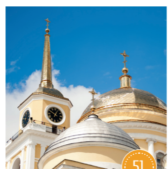
Монастырь Нило-Столобенская пустынь д. Светлица

izi TRAVEL Бесплатные аудиогиды по Тверской области. Скачайте приложение в App Store или Google Play