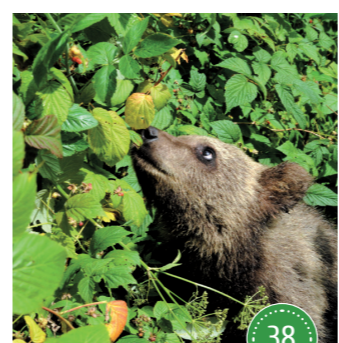
Биостанция «Чистый лес» д. Бубоницы

Ключ находится недалеко от села Оковцы, в 25 км от посёлка Селижарово. Вода из источника по своим качествам сравнима с талой ледниковой. Для православных людей источник стал считаться святым после обретения в этих местах в 1539 году Окецкой иконы Божией Матери.