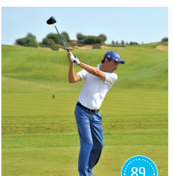
Завидово Конаковский р-н