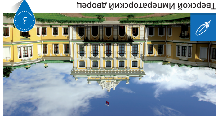
Тверской Императорский дворец 2. Тверь

В 2016 году после масштабной реставрации в его залах расположилась картинная галерея, где представлены полотна ивезских художников: Ивана Айвазовского, Исаака Левитана, Валентина Серова, Константина Коровина и многих других.