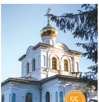
Святой Окецкий источник д. Оковцы

Монастырь, основанный в 1594 году, вместе с природой селигерского края производят незабываемое впечатление на каждого. До революции это был один из самых посещаемых монастырей России. Ныне в Богоявленском соборе пустыни почивают святые мощи преподобного Нила Столобенского.